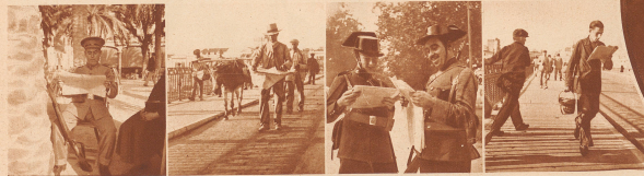
Die Halbesonnezeit: eine auf seinem Beobachtungsapparat und vorwärts sich in die Zeitung