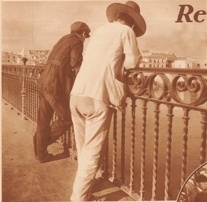
Eine Lieblingsbeschäftigung, die uns besonders zufällt: Am Morgen vor der Arbeit und über Mittag stehen die spanischen Arbeiter mit Vorliebe irgendwo an einem hübschen Wasser oder am Meer, lehnen über das Brückengeländer und schauen geradesam ins Wasser, stündelnd. Seit der Revolution ist die Neugier hervorgetreten, daß sie diese orientalische Ruhepause dazu benutzen, um mittels die politische Lage zu diskutieren.