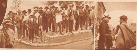
Immer noch gibt es in Spanien eine große Anzahl Anarchisten; aber auch diese interessieren sich jetzt für Politik, und so scharen sie sich um den gebildeteren Kameraden und lauern «Defensor de Granada» vor, als unser Photograph kam, sind sie aufgedrückt und stürzen dem blöden Mann in braunem Leder zugleich mißtraulich und erwartungsvoll entgegen

So kann es, daß unser Photograph, zuerst etwas enttäuscht, vorwegend sogenannte «Kleinigkeiten» festgehalten hat, denn merkwürdigerweise wurde gerade dort, wo er darrkam, nicht geschossen, nicht demonstriert, nicht gerevoluzt; dafür aber waren, demnach, am Leben und an der Entwicklung der Dinge interessiert, es war alles frisch und weich, wie die Erde nach einem lichten Regen. Trotzdem kam er leicht gekränkt heim und verargte es den Spaniern, daß sie ihre Revolution nicht sichtbar vor ihm abrollen. Wie hingegen waren zufrieden, denn wir halten von dem clausulösen Unsturz im Innern der Menschen und Häusern mehr als von Krach und Lärm. Vielleicht finden unsere Leser das Gleiche?