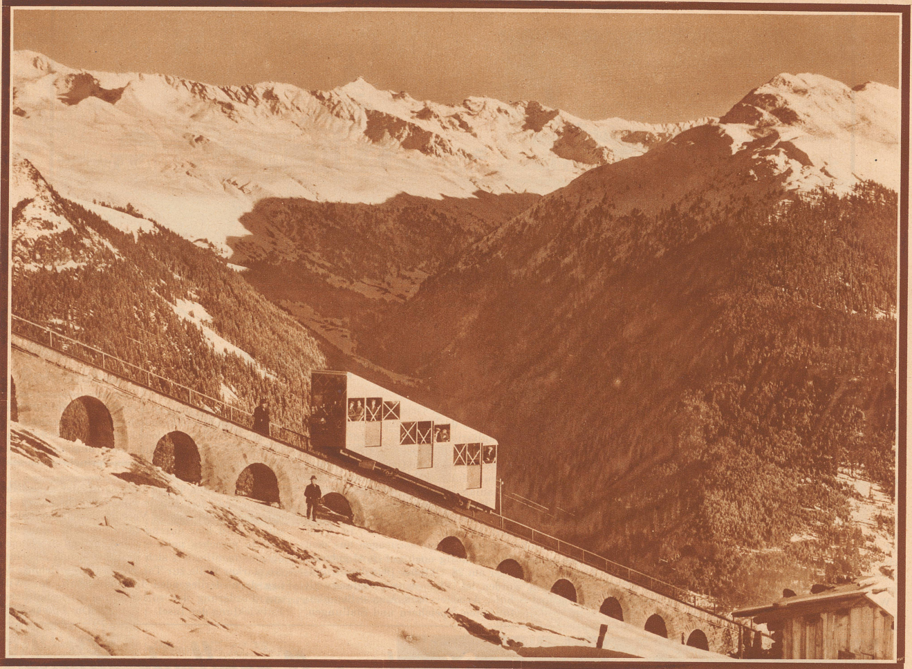
DAVOS-PARSENN-BAHN. Auf der Parsenn-Bahn, durch die eines der schönsten Skigebiete Graubündens erschlossen wurde, fanden die ersten Probefahrten statt. Blick auf die neue Anlage und das Valezgebiet, Flüela Weißhorn und die Pischa im Hintergrund Aufnahme Caspar