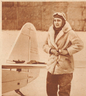
Elli Beinhorn , die durch ihren Afrikaflug bekannt gewordene deutsche Fliegerin, unternimmt jetzt einen Raid nach der Südsee. — Die kühne Fliegerin vor dem Start in Berlin am 4. Dezember

Ungeheures Aufsehen erregte in Deutschland und im Ausland die Tatsache, daß Adolf Hitler am 4. Dezember im Hotel «Kaiserhof» in Berlin für die englischen und amerikanischen Pressevertreter einen offiziellen Empfang veranstaltete, in dem er sie über das Verhalten seiner Partei zum Ausland bei der bevorstehenden Mächtigkeitsgreifung, an der er nicht mehr zu zweifeln scheint, informierte. — Hitler mit Hauptmann Goering