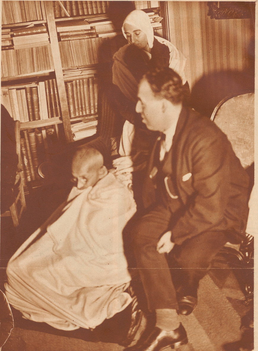
Gandhi im Hause Romain Rollands in Villeneuve