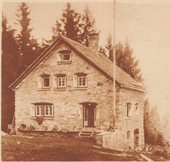
Das neue Klubhaus Schwarzenberg am Fuße des Piz Sol ob Mels, das dem Neuen Skiklub Zürich gehört und am 29. November eingeweiht wurde