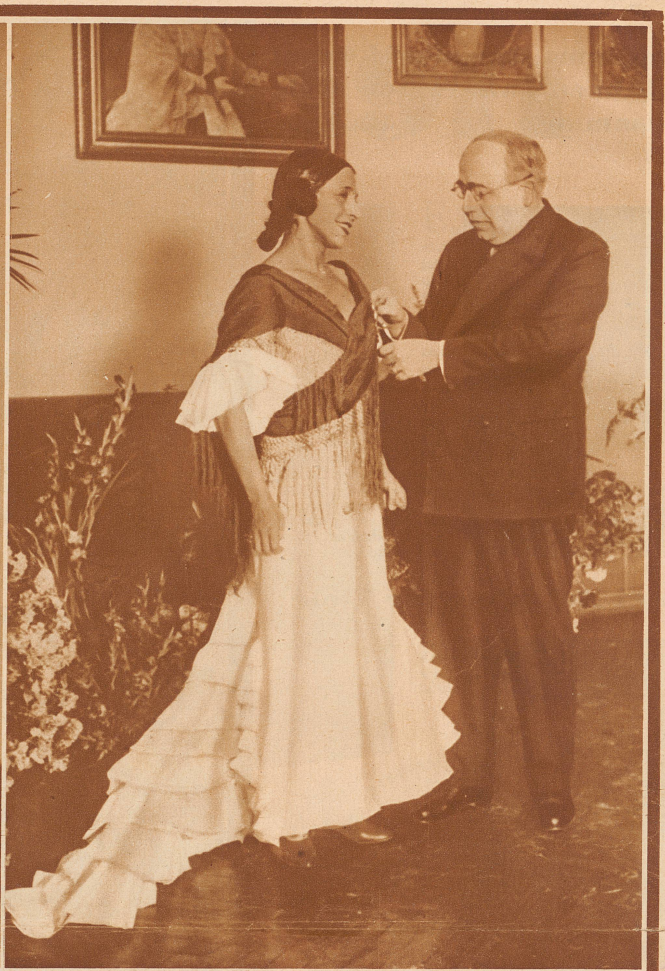
Der erste Präsident der spanischen Republik ist soeben gewählt und vereidigt worden: es ist der 60jährige Niceto Alcalá Zamora , der alte Revolutionär, der Zeit seines Lebens für die republikanische Idee kämpfte, die er nun noch zum Siege führen darf