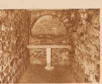
Das Grab des heiligen Mauricius Der Bischof von Bethlehem bei einem Spaziergang in St-Maurice

Ich war höchst erstaunt, als einst in Holland ein einfacher Schneidermeister mit der Frage zu mich herantrat, ob ich wisse, wo jetzt der Bischof von Bethlehem residirt. Ich wußte es nicht. Da meinte er lachend, ich sei offenbar ein kantonischer Schweizer, sonst würde ich das, denn der Bischof von Bethlehem habe seinen Sitz in der Schweiz. Das ist tatsächlich so. Der jetzige Abt des Klosters St-Maurice im Wallis ist gleichzeitig auch Bischof des Bistums Bethlehem in Palästina.