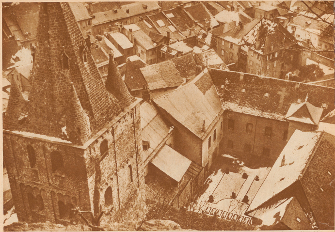
Blick auf die Kirche, einen Hof und einen Teil der Wohngebäude der Abtei von St. Maurice. Der architektonisch interessante Turm stammt aus der Zeit Karls des Großen und beherrscht ein weit in Land herein verläufenes Gölle.