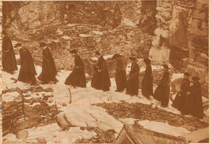
Der Weg von den Wohnsitzen der Mönche zur Klosterkirche führt über das Gräberfeld der städtischen Legion. Die erkennbaren Mauern sind Überreste der ersten Kirche und zerfallene Gräber.