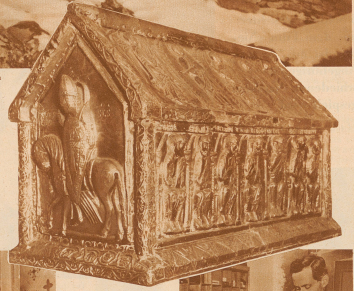
Silberreliquiar aus dem Kirchenschatz