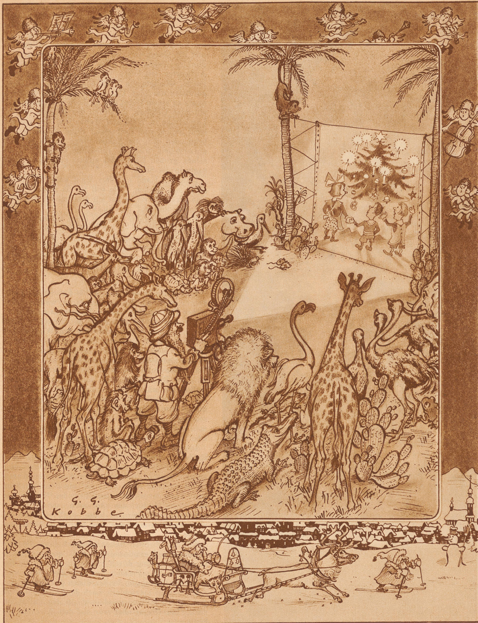
Der Weihnachtsabend des Afrikaforschers