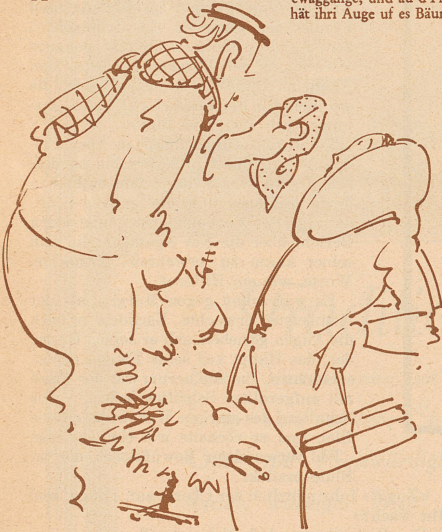
3. Häxgüsi! S'hät Sie g'chrazet!! F'chli Harz isch am Näsli. Sell is ewäg butze?? Mir em rote Nastuech!