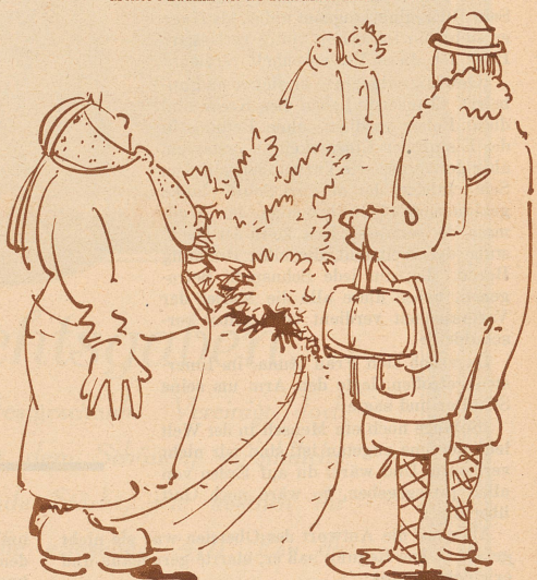
5. Bäumli wo bischt!!!! Bäumli was hescht!!