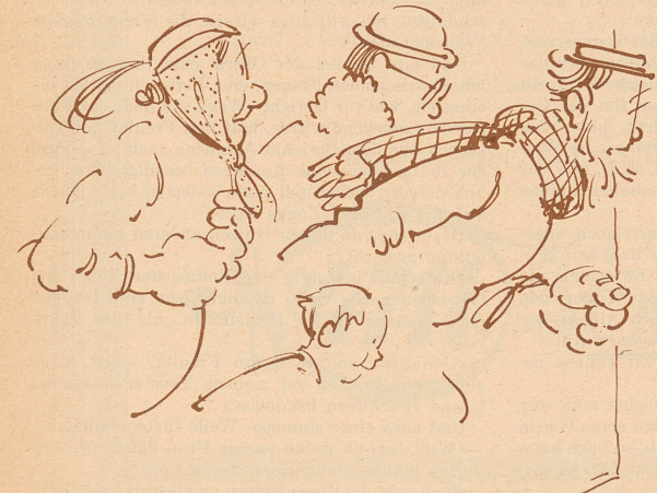
6. S'Bäumli hät güööchnet. Holer's! Heber's!