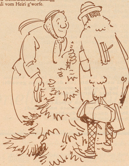
4. Underesse fangt d'Kathri ihrsrüts Verchafsverhandlige na! «Z'tüür?» Mi Seel nüd! — S'Bäumli .....