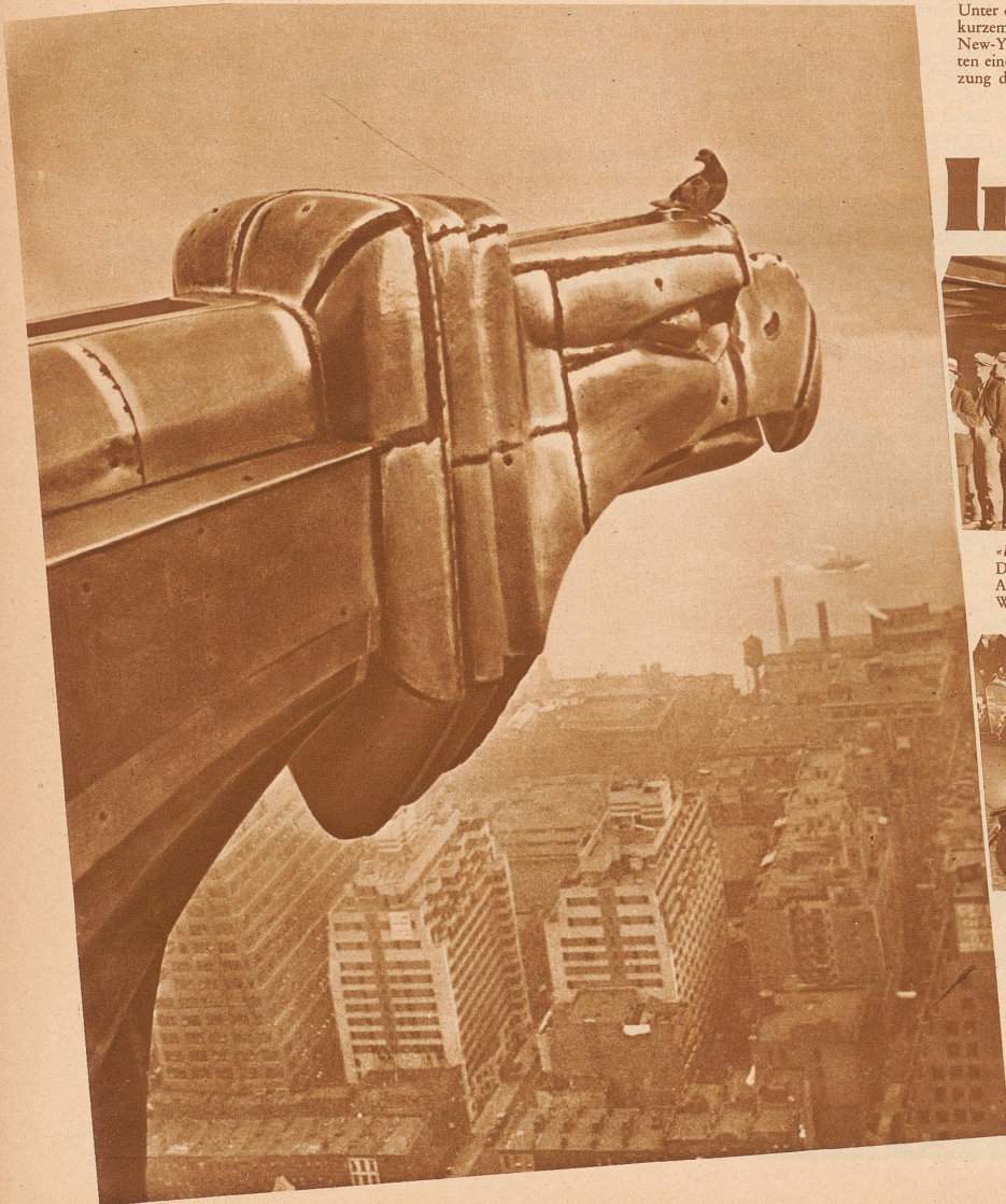
Bild links: Auf dem Turm des neuvollendeten Chrysler-Gebäudes, auf einer der Balustraden in Tiergestalt, die Ähnlichkeit mit den gotischen Wasserspeichern von Notre Dame in Paris haben, 140 m hoch über Elend und Luxus, – sitzt eine der ehrgeizigen New-Yorker Tauben, die ganz entgegen ihren sonstigen Lebensgewohnheiten, mit den immer höher wachsenden Gebäuden auch beständig höhere Flüge wagen und neue Tauben-Rekorde aufstellen. Normale Tauben fliegen nämlich nie höher als bis 15–20 m

Das teuerste Auto der Welt auf einer New-Yorker Automobil-Ausstellung: ein perlgrauer Rolls Royce in U-Boatform. Preis: Rund 100 000 Franken