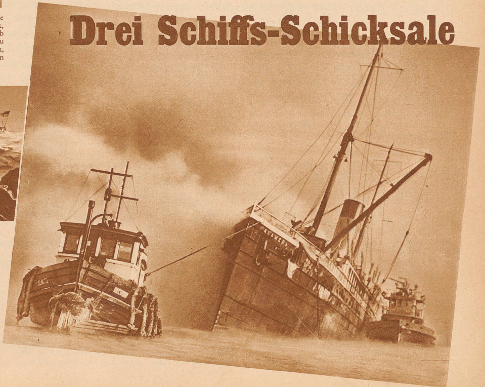
Bild rechts: Der amerikanische Frachtdampfer «Alameda», der seit 1908 zwischen Seattle und Alaska kursierte, geriet im Heimathafen Seattle in Brand. Löscharbeiten waren zwecklos und so wurde die «Alameda» in die offene See hinausgeschleppt und dort ihrem Schicksal überlassen. Der Wert des Schiffes wird auf 5 Millionen Schweizerfranken geschätzt