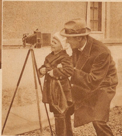
«Lichtheil» ist des Photographen Gruß. Ein kräftiges Lichtheil ruft auch Ihr Mitarbeiter H. Leemann allen Lesern der «Zürcher Illustrierten» zu. Gutes Licht beglückt und bezaubert uns und macht uns erfolgreich. Wenn's daran gebracht, wird alles so gleichmäßig, so wesenlos. Kontrast ist, was uns fesselt und bezaubert und auch vorwärts bringt. Darum viel Licht im neuen Jahr. H. Leemann