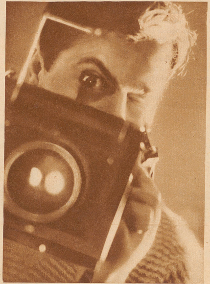
Zwei Augen schaffen für Sie. Die Apparatur allein tut es nicht, entscheidend ist der Mensch hinter der Kamera, die ein rein technisches Ausdrucksmittel bedeutet, wie dem Maler Pinsel und Farbe. Im Augenblick der Belichtung will die Sache gefühlt, erfaßt sein. Möge das Gefühle eines Bildes, einer ganzen Reportage dem Leser bewußt werden. Möge der Leser unserer Arbeit im kommenden Jahr seine Sympathie bezeugen, dies mein Neujahrsgruß und -wunsch. E. Mettler