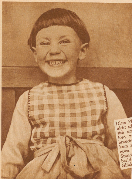
Diese Photo hat allerhand «Qualitäten». Sie ist nicht schön, ist ohne Stimmung, noch handelt es sich um ein Kunstwerk. Eine ganz anspruchslose, zufällige, ungestellte Aufnahme. Und sie braucht weder der Redaktion, noch dem Publikum zu gefallen!... Mir ist sie recht, — vielmehr vom Standpunkt untraditioneller, moderner Bildberichterstattung aus. Trotz Ed. Keller Herzliche Glückwünsche.