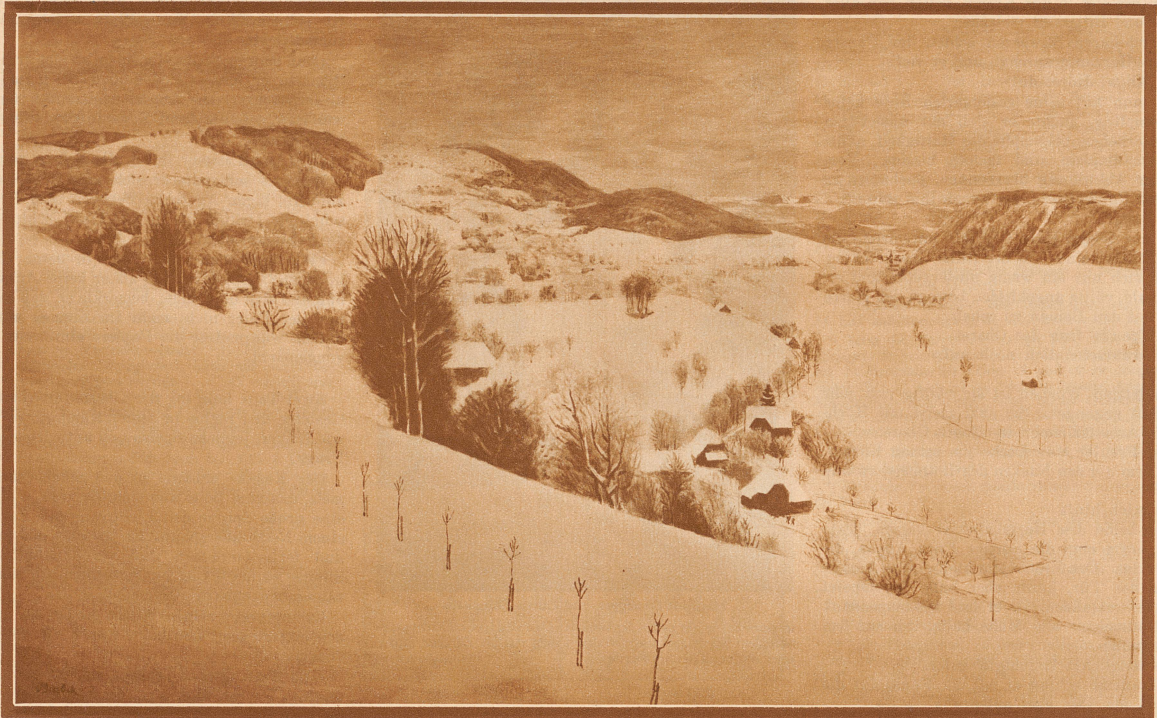
Schneelandschaft bei Bern von V. Surbeck