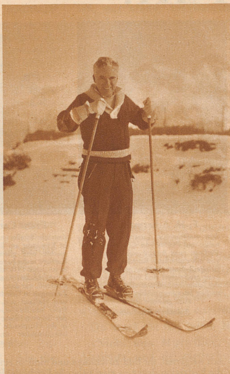
Charlie Chaplin beim Skitraining in St. Moritz