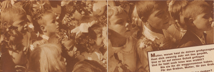
Aufnahmen von einem Kinderfest in Zürich von E. Mettler