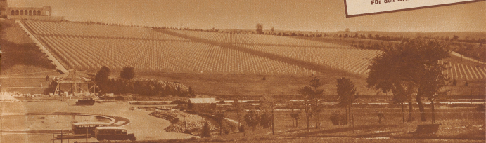
Amerikanischer Kriegfriedhof in Romagne sous Montfaucon in den Argonnen. — Groß, aber nicht der größte!