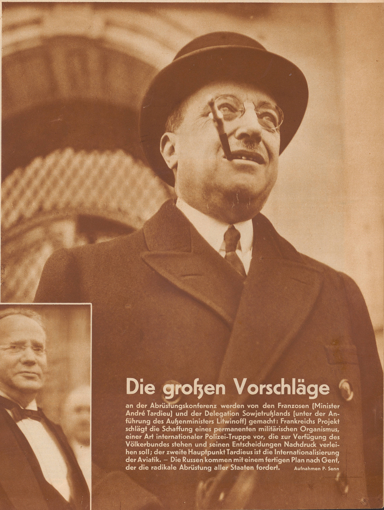
Rechts: Der Präsident der französischen Dele- gation: Kriegsminister André Tardieu

Druck und Verlag: Conzett & Huber Zürich und Genf