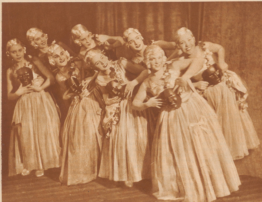
Jim und Jill

eine englische Operettenrevue von Elis und Wyers wird im Stadttheater Zürich mit großem Erfolg aufgeführt