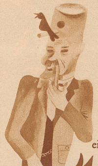
einen Vogel haben