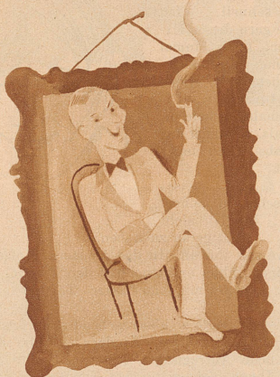
im Bilde sein