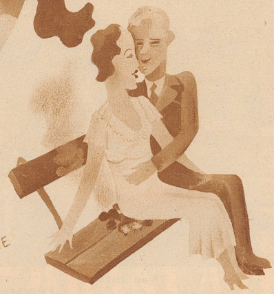
auf Kohlen sitzen