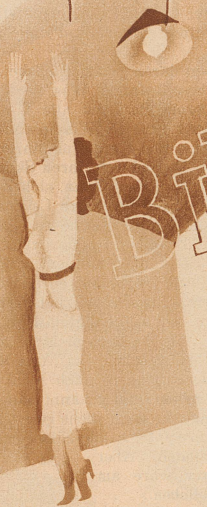
sich nach der Decke strecken