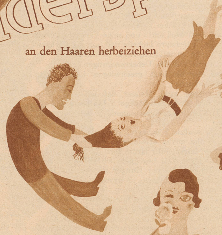
an den Haaren herbeiziehen