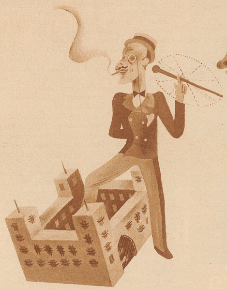
mit einem Bein im Zuchthaus stecken