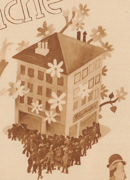
das Geschäft blüht