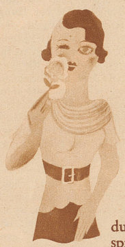
durch die Blume sprechen