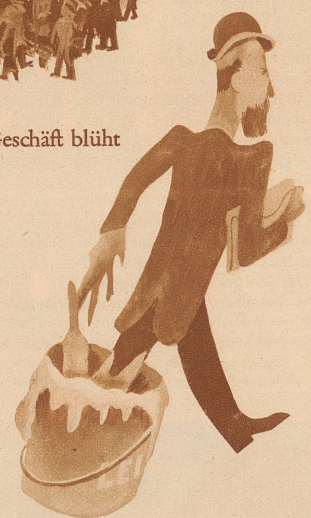
aus dem Leim gehen