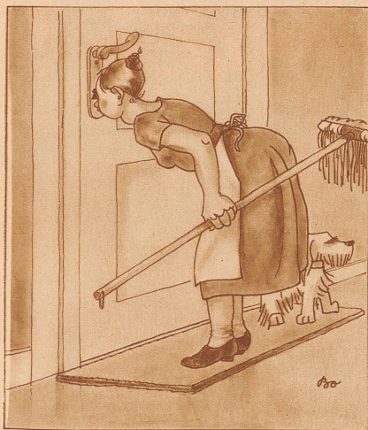
Goethe: «Zwar weiß ich viel, doch möchte ich alles wissen!»

«Nanu, gnädige Frau, Sie wollen schon wieder abreisen? Ich dachte, Sie wollten die ganze Saison hier bleiben?»