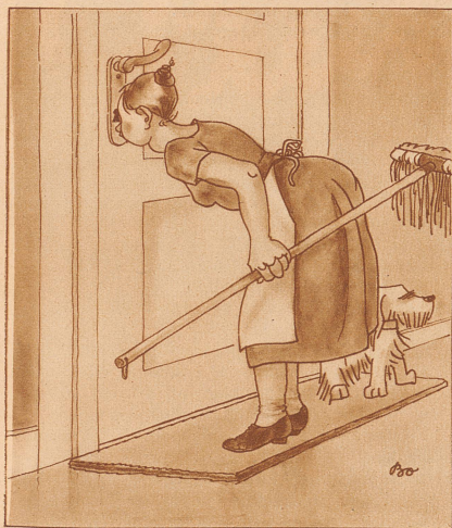
Goethe: «Zwar weiß ich viel, doch möcht ich alles wissen!»