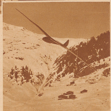
So turnt er jetzt, – mit seinem Segelflugzeug. Hier ist er über dem Davoser-See