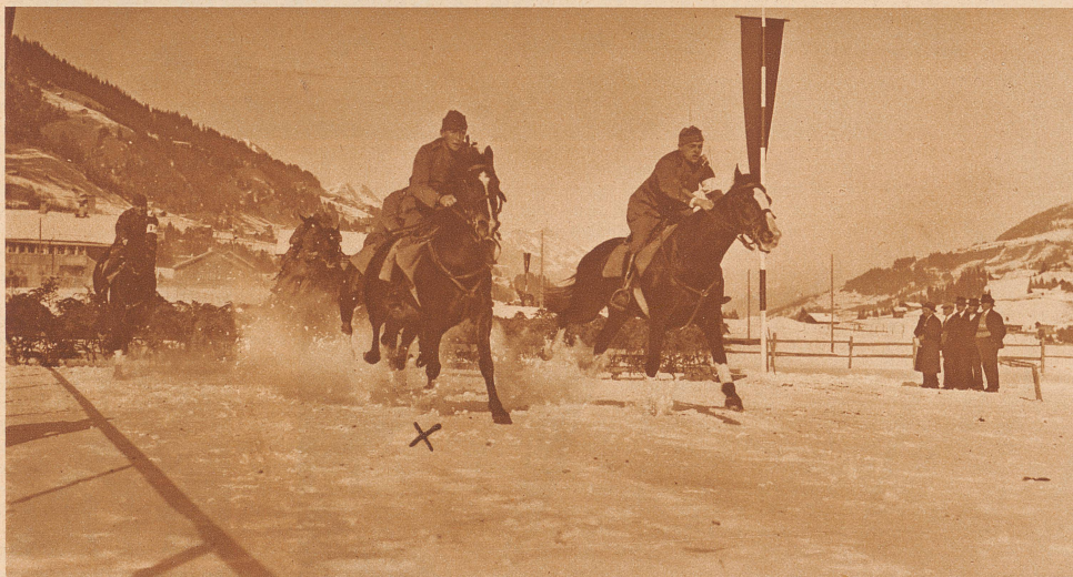
Korporal Messerli auf «Aerop» (X) der Sieger im Hürdenrennen für Unteroffiziere und Gewinner des Preises vom Hahnenmoos