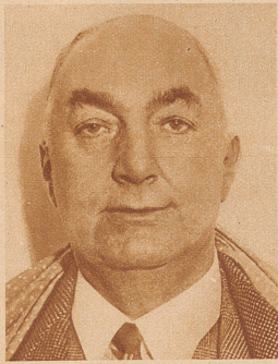
Edgar Wallace der fruchtbarste und am meisten gelesene Krimi- nalschriftsteller unserer Zeit, starb an den Folgen einer Lungener- zündung

Brahms C-Moll-Symphonie im selben Konzert. Wie ihr Mann, wagt sie es, ohne Noten zu dirigieren