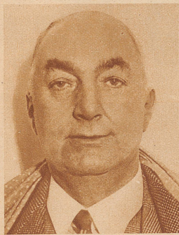
Edgar Wallace der fruchtbarste und am meisten gelesene Krimi- nalschriftsteller unserer Zeit, starb an den Folgen einer Lungent- zündung

Brahms C-Moll-Symphonie im selben Konzert. Wie ihr Mann, wagt sie es, ohne Noten zu dirigieren