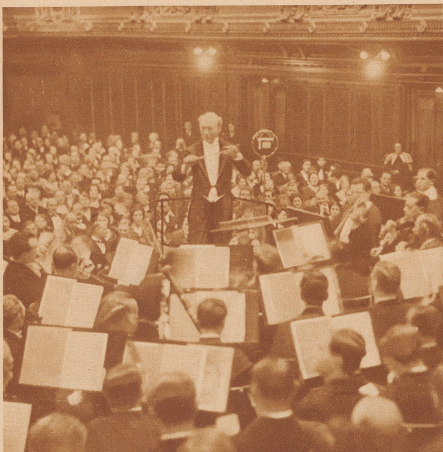
Felix Weingartner dirigiert

die Beethovensche IX. Symphonie in der Budapester Musikhochschule