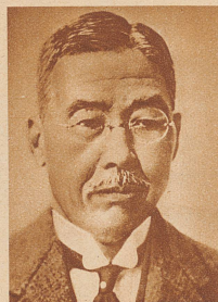
Der ehemalige Finanzminister Japans, Junnosuke Jnoyue , wurde am 9. Februar in Tokio durch drei Schüsse ermordet. Jnoyue hatte sich in der letzten Zeit durch seine Haltung in der mandchurischen Frage in nationalistischen Kreisen viele Feinde gemacht. Es ist anzunehmen, daß der Täter, der gefaßt werden konnte, aus fanatischen nationalen Motiven gehandelt hat

In aller Stille, infolge der politischen Wirren kaum beachtet, schuf England ein Riesenwerk zur Fruchtbarmachung des indischen Steppenlandes. Der soeben eingeweihte Staudamm, der größte der Welt, wird die Wasser des Indus stauen und in Seitenkanäle leiten. Die Kosten des Baues betragen etwa 250 Millionen Franken