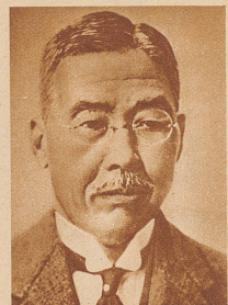
Der ehemalige Finanzminister Japans, Junnosuke Jnoyue , wurde am 9. Februar in Tokio durch drei Schüsse ermordet. Jnoyue hatte sich in der letzten Zeit durch seine Haltung in der mandschurischen Frage in nationalistischen Kreisen viele Feinde gemacht. Es ist anzunehmen, daß der Täter, der gefaßt werden konnte, aus fanatischen nationalen Motiven gehandelt hat

In aller Stille, infolge der politischen Wirren kaum beachtet, schuf England ein Riesenwerk zur Fruchtbarmachung des indischen Steppenlandes. Der soeben eingeweihte Staudamm, der größte der Welt, wird die Wasser des Indus stauen und in Seitenkanäle leiten. Die Kosten des Baues betragen etwa 250 Millionen Franken