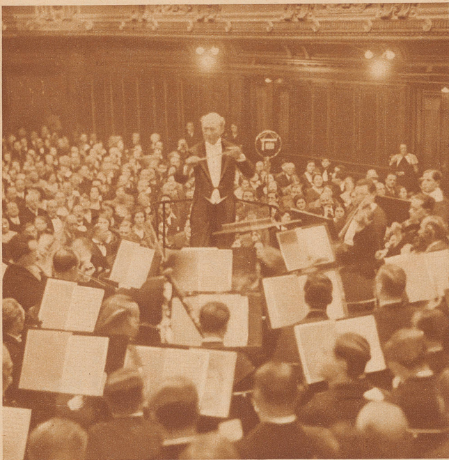
Felix Weingartner dirigiert

die Beethovensche IX. Symphonie in der Budapester Musikhochschule