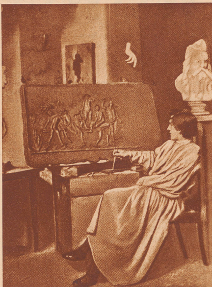
Gerhart Hauptmann, der als Bildhauer anfing, 20jährig in seinem Atelier in Rom

Er suchte sich die Nettteste aus, und als er nach Indien zurückfahren wollte, schlug er ihr vor, sie zu heiraten. Sie war beglückt und glaubte ihn so zu lieben, daß sie mit ihm ging. Auf dem Schiff aber machte der Inder schon die ersten trüben Erfahrungen. Er bemerkte, daß sie sich immer an Weiße anzuschließen versuchte und sich nicht mehr so um ihn kümmerte wie in Deutschland. Er machte ihr deswegen Vorhaltungen, auf die sie immer mit Weinen antwortete. Er liebte sie aber so stark, daß er glaubte, in Indien, wenn sie nur ihn allein habe, dann werde sie ihn so wieder lieben wie in Deutschland. So sah er über alles während der Reise hinweg, was ihn ärgerte, und hoffte auf später. Als sie dann in seinem Haus ankam, wünschte er, daß sie sich nur in ihren