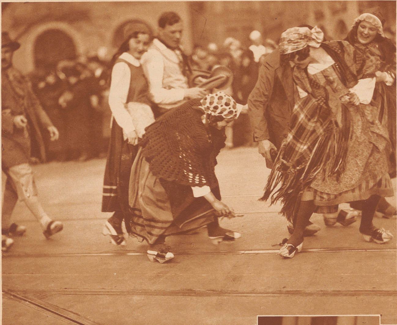
Sieht dieses Bild nicht aus wie eine schöne Tanzszene, betitelt vielleicht «Das Spiel mit der Blume»? Nun, wer Augen hatte, konnte derlei sehen, als die Tessiner kürzlich durch die Bahnhofstraße zogen, um beim Tessinerfest des Touringclubs Zürich teilzunehmen und für die Echtheit zu sorgen. — Der Empfang in Zürich, das Fest selber, die Reden Mortas und der andern Herren, das finanzielle Ergebnis zu Gunsten bedürftiger Tessiner Bergbauern, alles zusammen war wunderschön und ein großer Erfolg des T. C. S.