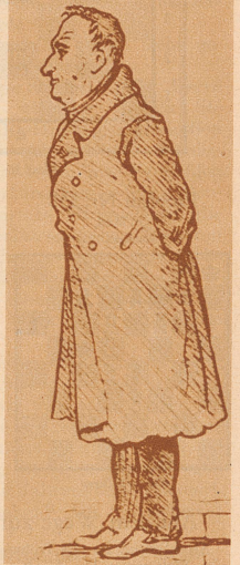
«Der Herr Geheimrat», Karikatur von William Makepeace Thackeray, Weimar 1830

Was ist das für ein Gewäch über den Faust! Alles erbärmlich! Gebt mir jedes Jahr 3000 Taler, und ich will euch in drei Jahren einen Faust schreiben, daß Ihr die Pestilenz kriegt.