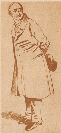
«Der Autor des Faust» als Karikatur von Maclise. («Frasers Magazin», März 1832)

«Als Seine Majestät Friedrich Wilhelm III. vor Jahren bei unserer Herrschaft in Weimar zum Besuche anwesend war, hatte sich eine Menge Volks aus der Umgegend eingefunden, welches, ihn womöglich zu sehen, das Schloß umstand. Ich, der ich in jener Zeit bei extravaganten Gelegenheiten noch zu Hofe ging, begegnete auf dem Heimwege einem alten thüringischen Leineweber, welcher früher, wo ich eine kleine ländliche Besetzung gehabt, dort mein Nachbar gewesen war. «Nun, mein Alter!» — sprach ich ihn an — «Ihr seid denn auch heringekommen, den König zu sehen?» — «Ja, Herr Geheimrath», antwortete der Weber, «aber das ist ja nicht! Ich dachte, 's sollte der alte Fritze sein.»