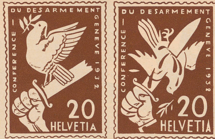
Eine russische Karikatur für die Abrüstungskonferenz.

Die Sache begann damit, daß sich, während wir plaudernd durch den körnigen Sand tippelten, der uns die Stiefel zerfraß wie Lauge, in unseren Gesprächen immer häufiger und hartnäckiger gewisse Motive bemerkbar machten. Beispielsweise begann der Grieche tief gerührt zu erzählen, daß in seiner Heimat aus den Marmorbrüchen sonderbare Quellen hervorsprudelten, die säuerlich schmeckten und so perlt wie Champagner. Darauf erzählte ich, daß im Komitat Somogy an den Wegrändern komische, kleine Schenken stünden, wo man zum leichten Säuerling brunnengekühlte Selter bekommen kann. Dann packte ich ohne jeden Uebergang eine Jugenderinnerung aus: In Budapest erschien an manchen Straßenecken oft ein ernster Beamter und drehte den Hahn der Straßenleitung auf, so daß ein baumstamm-dicker Strahl hervorquoll, und die Kinder barfuß im