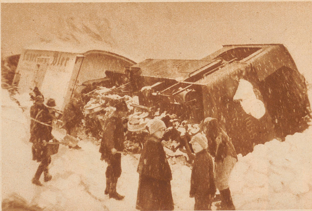
Ein Lawinenunglück auf der Brüning-Bahn. Während der letzten großen Schneestürme ging zwischen Kaiserstuhl und Lungern eine Lawine nieder und warf einen vorüberfahrenden Zug um, wobei glücklicherweise niemand verletzt wurde