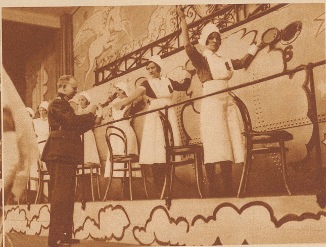
Die große irische Volkslotterie gibt einen Anteil ihres Gewinnes an die öffentlichen Spitäler ab. Es sind darum Krankenschwestern in Berufstracht, welche die endgültige Ziehung aus der riesigen Trommel in Gegenwart des Polizeipräsidenten des Irischen Freistaates am 14. März vornehmen