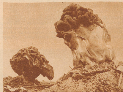
Zwei eßbare Gespenter