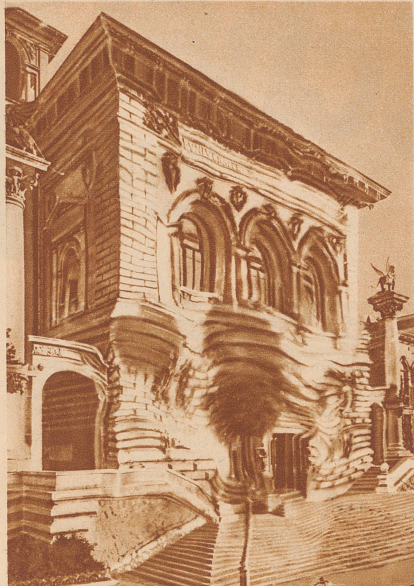
Das erste große Frühlings-Wackeln der Stadt Biribi