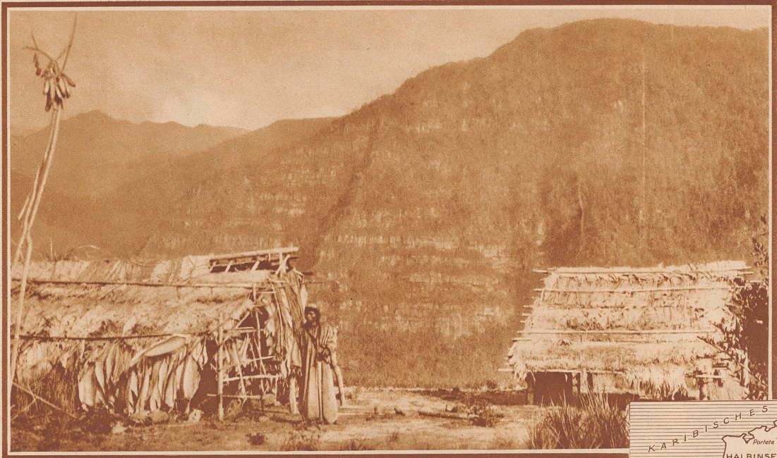
So wohnen die freiheitsliebenden Motilon-Indianer in den Kordillern Venezuelas. Unzugängliche Felsen und dichte Urwälder schützen ihre Hütten und ihren Boden vor den fremden «Bleichgesichtern», die, angezogen durch die Bodenschätze, in allen Erdteilen die eingeborenen Menschen und ihre Heimat bedrängen