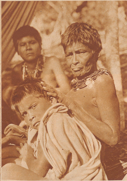
Eine Indianermutter mit ihrem Sprössling, dessen Kopfhaut der Reinigung bedarf. Der Ertrag der diesbezüglichen Jagd (Läuse und Zecken) wird mit tiefster Miene verzehrt

Seit der Entdeckung Amerikas durch Kolumbus am Ende des 15. Jahrhunderts bis zum heutigen Tage hat dort drüben auf dem neuen Kontinente der weiße Mann den Indianer zurückgedrängt, seine Kultur vernichtet und von seinem Lande Besitz ergriffen. Der Weiße kämpft um materielle Güter, der Indianer jedoch um seine Existenz und Freiheit. Die Aussichten sind leider zu ungleich, das Ende ist zum voraus zu übersehen. Die sogenannte Zivilisation wird bald auch die letzten unabhängigen, freien Indianerstämme verschlungen haben.