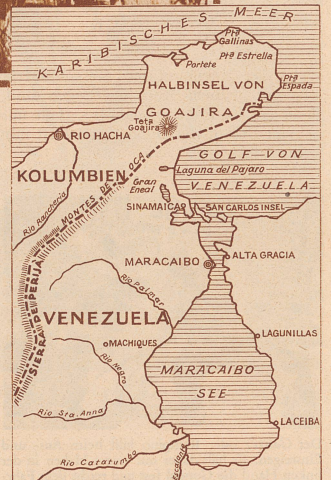
Kartenskizze vom Maracaibo-See (Venezuela). Links die Sierra de Perijá, der Wohnsitz der Motilon-Indianer