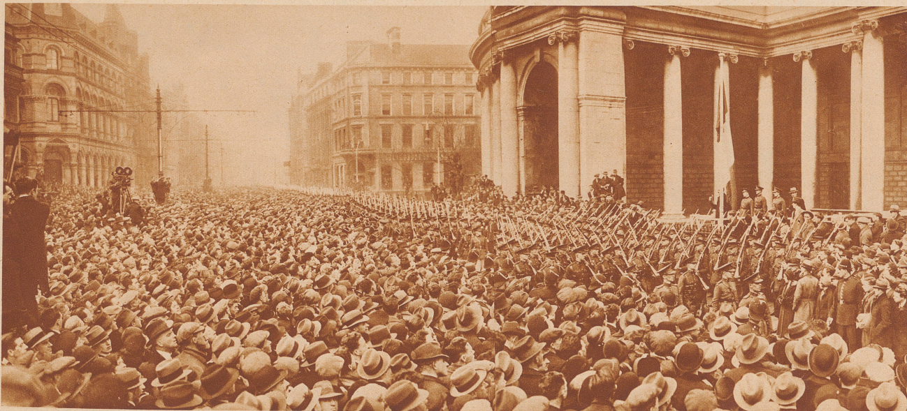
Der St. Patrickstag, das Fest des irischen Nationalheiligen, wurde dieses Jahr mit besonderem national gesteigertem Jubel begangen. — Defilee der Truppen des irischen Freistaates am St. Patrickstag in Dublin