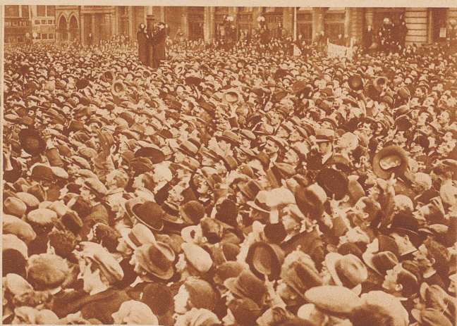
Freude über neue Freiheit. Auf Befehl des irischen Ministerpräsidenten De Valera wurden sämtliche bis jetzt eingekerkerte politische Sträflinge auf freien Fuß gesetzt. Eine ungeheure Menschenmenge gab in einer Riesendemonstration ihrer Freude darüber spontanen Ausdruck