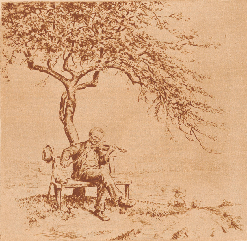
Radierung von Otto Quante