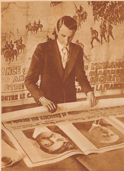
Der Wahlkampf in Frankreich hat begonnen.

Gottseidank! denken sie; denn der Wagen, der