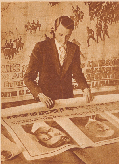
Der Wahlkampf in Frankreich hat begonnen.

Gottseidank! denken sie; denn der Wagen, der