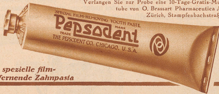
Die spezielle film-entfernende Zahnpasta

Verlangen Sie zur Probe eine 10-Tage-Gratis-Muster-tube von O. Brassart Pharmaceutica A.-G., Zürich, Stampfenbachstraße 75.