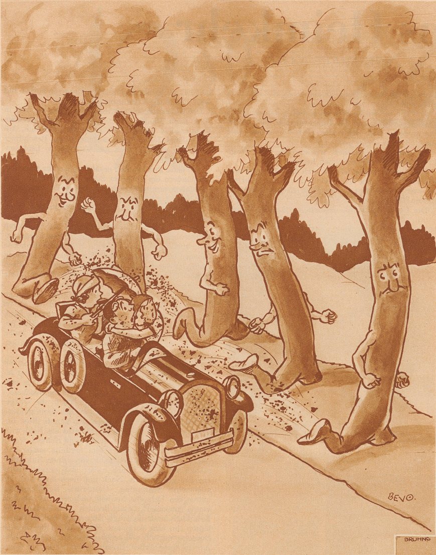
«Die Bäume schlagen aus»

Der im letzten Drittel des 18. Jahrhunderts in Berlin wirkende beliebte Arzt Marcus Herz hatte einen Patienten, der dauernd in medizinischen Büchern las und sich nebenbei immer selbst zu kurieren suchte. Als er eines Tages wieder einmal seine nicht recht verdauten medizinischen Kenntnisse an den Mann, d. h. an Herz, bringen wollte, sagte dieser: «Nehmen Sie sich in acht! Sie sterben noch einmal an einem Druckfehler.»