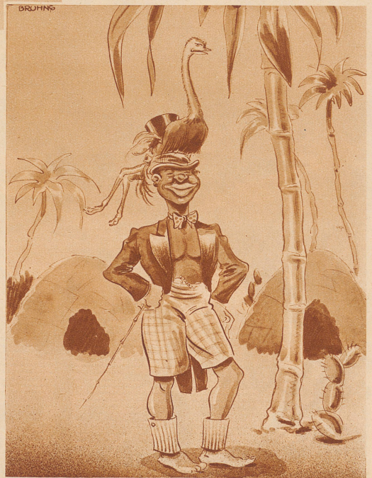
Stelldichein am Kongo.

Ausgleich. (In England werden nur noch magere Polizisten angestellt, weil die Gefahr des Getroffenwerdens von einer Kugel der Verbrecher kleiner ist.) Bill: «Hast Du gehört, es wird nur noch dünne Policemen geben, damit wir sie weniger gut treffen». James: «Ja, da werden wir größere Kugeln nehmen müssen.»