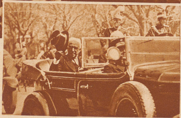
Der Präsident der spanischen Republik Alcalá Zamora (im Auto) bei der Abnahme einer großen militärischen Parade am 14. April