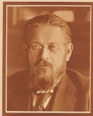
Albert Thomas Direktor des Internationalen Arbeitsamtes starb am 8. Mai in Paris, 54jährig. Nach einer großen politischen Karriere, die den Bäckersohn aus Champigny zum sozialistischen Deputierten des Seine-Departements und während des Krieges zum Munitionsminister im Kabinett der Landesverteidigung machte, folgte er 1919 dem Ruf als Leiter des Internationalen Arbeitsamtes, dem er dreizehn Jahre mit seiner unerhörten Arbeitskraft und großen Organisationsfähigkeit vorstand. Die Schöpfung der internationalen Arbeitsorganisation ist allein sein Werk. Für das B. I. T. ist sein früherer Tod ein nicht leicht zu verwindender Schlag