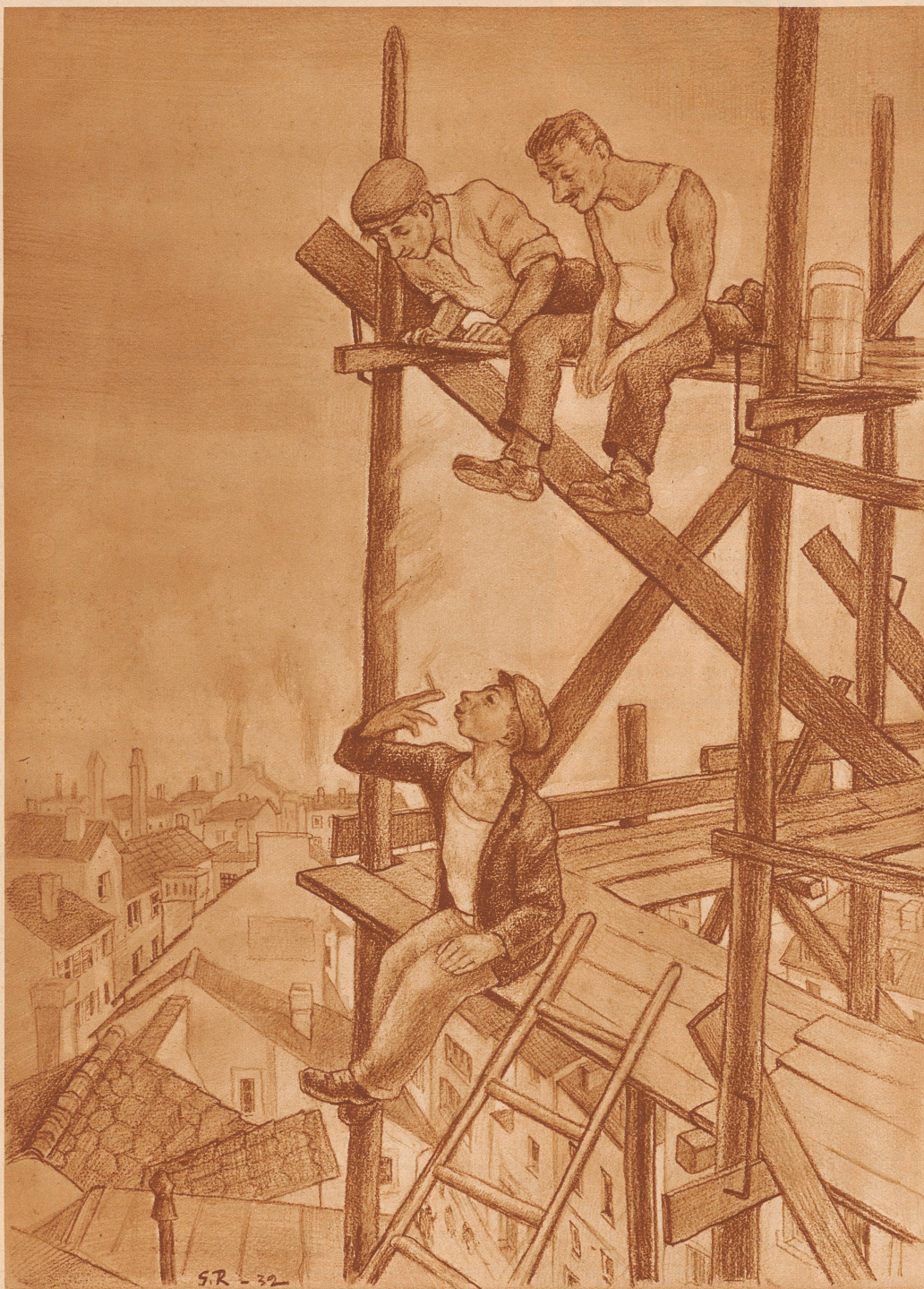
2. G. Rabinowitch, Zürich: «Auf dem Bau»

Schweizer Künstler illustrieren ein Schlagwort