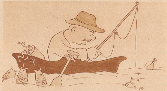
Wenn der Angler die Wurmdose offen läßt