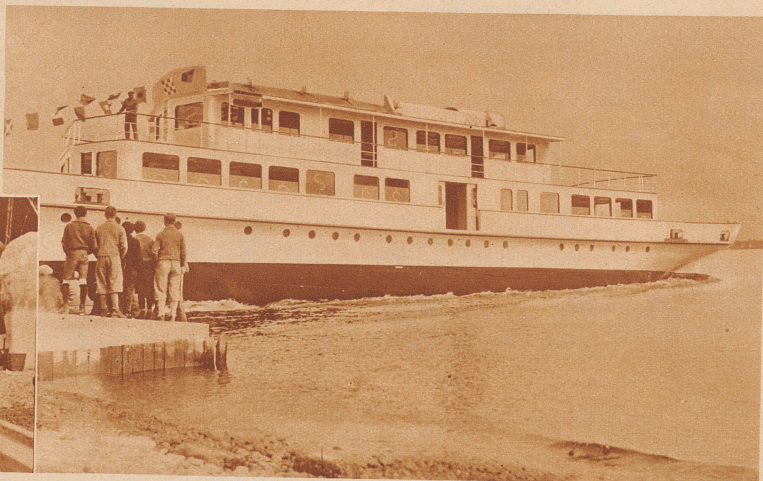
Das Motorschiff «Thurgau» gleitet von der Werft ins Schwäbische Meer. Das Schiff ist 44 m lang, 4 Stockwerke hoch, besitzt einen Tiefgang von 1,47 m, eine Wasserverdrängung von 222 Tonnen und kann 450 Personen fassen