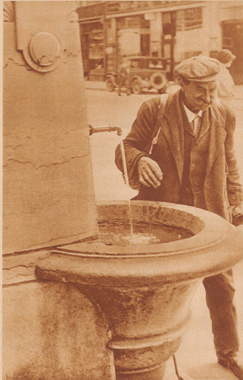
AUFNAHMEN BISCHOF UND ACKLIN