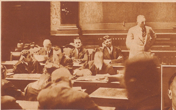
Die Angeklagten während der Verhandlung vor dem Schnellgericht. Ganz links, in der letzten Reihe, der bekannte nationalsozialistische Politiker Gregor Straßer

Am 8. Mai stürzten am Quai von Herbauville in Lyon infolge Erdbebens am Caluire-Hügel zwei fünfstöckige Wohnhäuser ein. Die beiden Gebäude waren von 54 Personen bewohnt, von denen 27 bei der Katastrophe ums Leben kamen. Da die Gefahr weiterer Einstürze besteht, mußten die Bewohner von etwa 50 Häusern in der Umgebung der Unfallstelle evakuiert werden. Die Räumungsarbeiten gestalteten sich sehr gefährlich und stehengebliebene Häusermauern und Teile des Hügelabhanges drohten jeden Augenblick, die Rettungsmannschaften unter sich zu begraben. Deshalb wurden drei kleinkalibrige Geschütze aufgeföhren, die stundenlang in die Trümmer hineinschossen