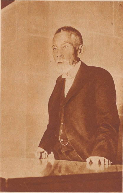
Attentat auf den japanischen Ministerpräsidenten. Auf den japanischen Premier- und Außenminister Inukai wurde am 15. Mai ein Revolverattentat verübt, an dessen Folgen er nach wenigen Stunden starb. Der Mörder, ein Offizier der Landarmee, gehört anscheinend zu einem Komplott, das das Attentat lange vorbereitet hatte. 5 weitere Offiziere von der Marine und 13 Armeekadetten sind im Zusammenhang mit dem Attentat von der Polizei festgenommen worden