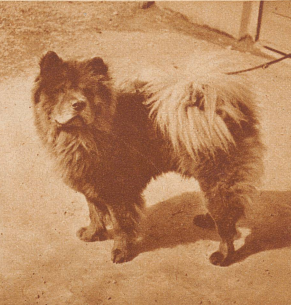
«Chang» erhielt den Siegertitel der Chow-Chow-Rasse. Er stammt aus der Linie des berühmten «Lemming», der für 50 000 Fr. verkauft wurde. Für den Bahntransport nach Basel war «Chang» für 25 000 Fr. versichert