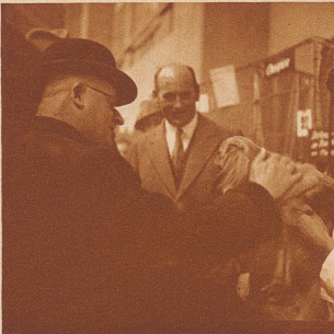
Bundesrat Motta, der Ehrenpräsident der Ausstellung, begrüßt einen Erstpreisträger