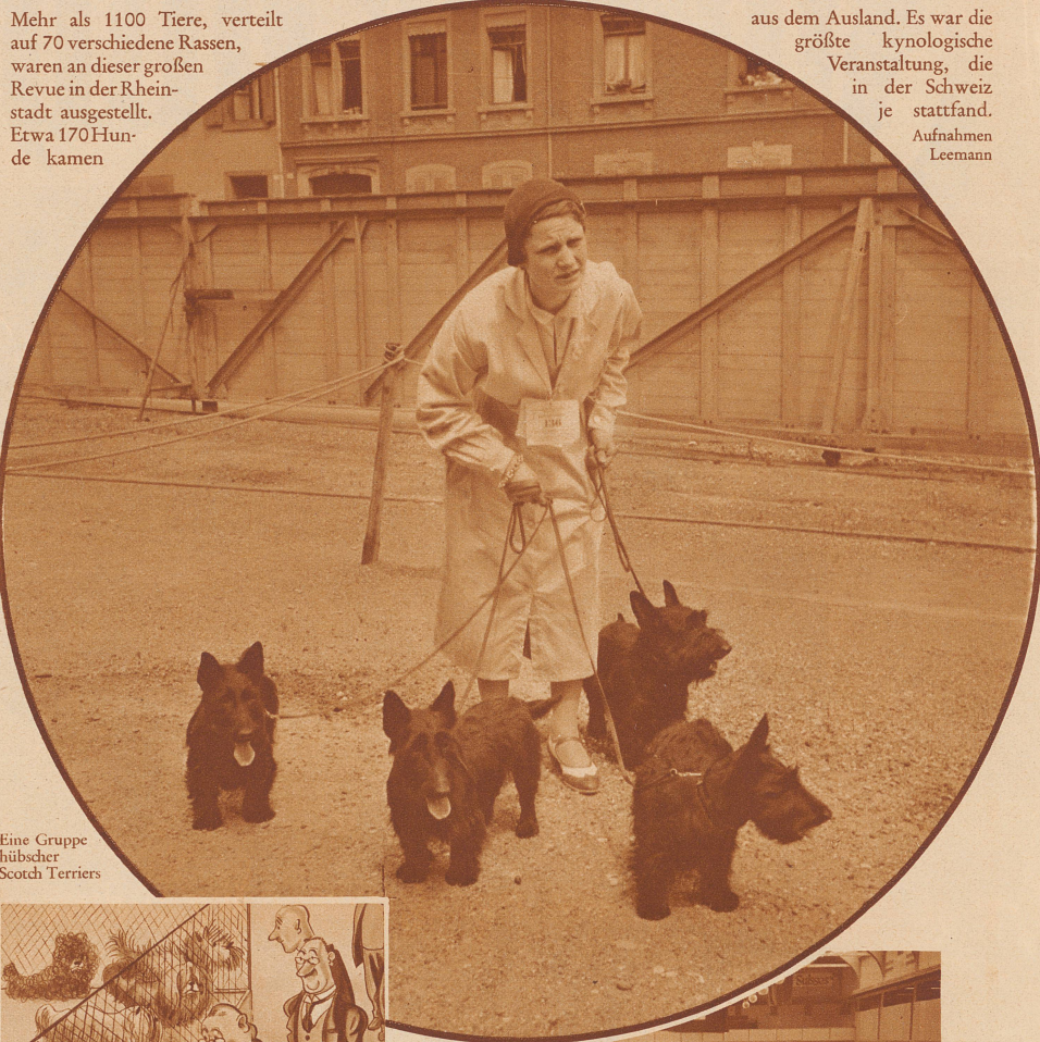
Eine Gruppe hübscher Scotch Terriers