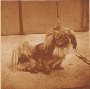
«Ching Foo of Oldbourne», der Champion der Pekinesen. Er erzielte bereits in England 18 erste Preise