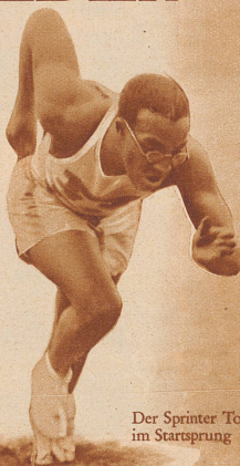
Der Sprinter Tolan im Startsprung

sen. Wenn die Amerikaner heute indianische Prärieläufer herbeiholen, um ihre Ueberlegenheit anlässlich der Olympischen Spiele von Los Angeles noch ausgeglichener zu gestalten, so bedeutet diese Erscheinung nichts anderes, als daß auch die Briten ohne weiteres berechtigt wären, aus ihren Kolonien oder Protektorsgebieten Steppenläufer und Wildleute heranzuholen, um sie im Wettkampfe für olympische Ehren einzusetzen. Es