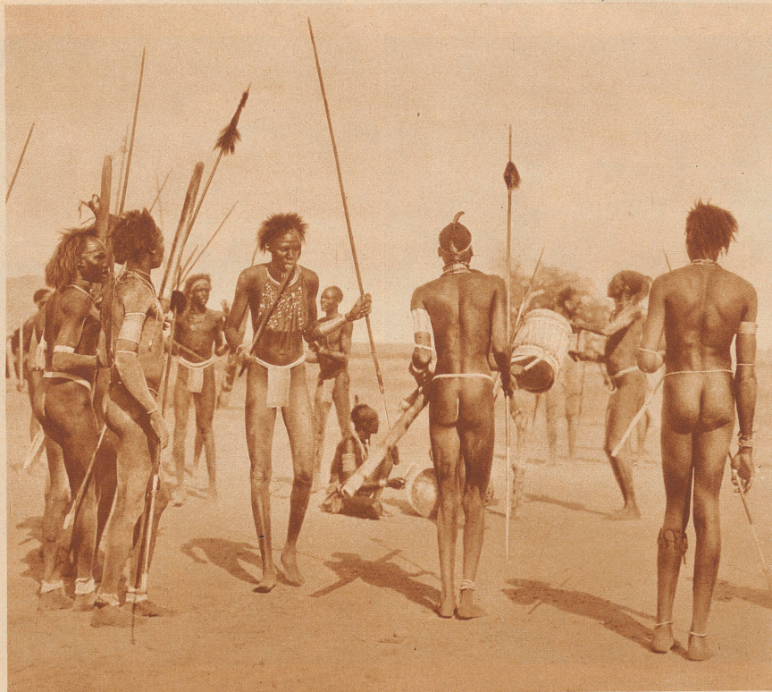
Die langbeinigen Dinka-Neger leben als Viehzüchter in völliger Unberührtheit mit der Zivilisation