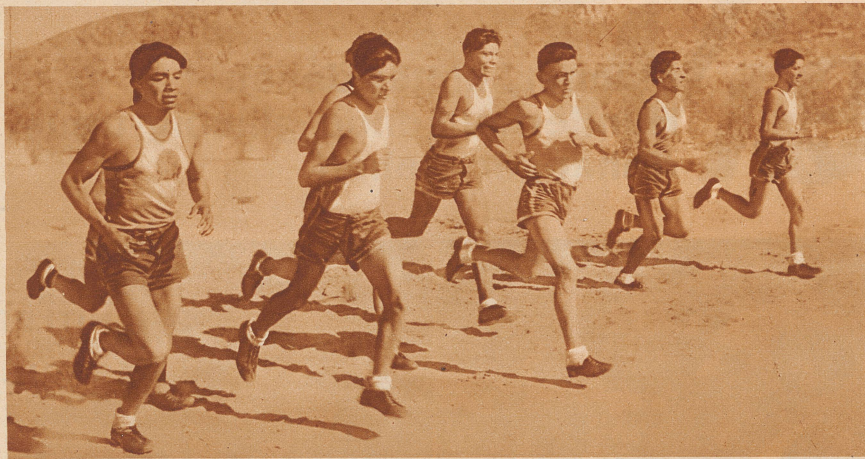
Die indianische Olympiade-Mannschaft unterzieht sich in Palm Springs in Kalifornien einem gründlichen Training. Man beachte die Gelöstheit der Lauftechnik, das weiche Durchschwingen der Körper und den raumgreifenden Schritt. Von diesem ausgeglichenen Läufermaterial erwarten die Amerikaner besonders hohe Leistungen