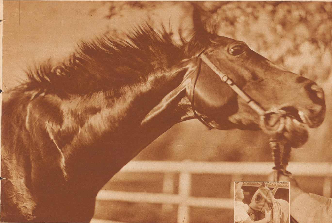
Nach dem Sieg. «Amalfi» erhält eine erfrischende Abwaschung