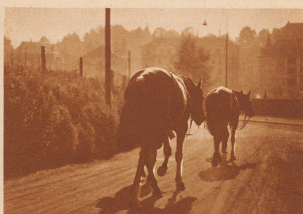
Auf dem Heimwege zum Stall, wo ihn die fachmännische Pflege erwartet