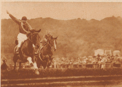
Der Reiter unseres Favoriten hält diesen anfangs im Hintertreffen und überläßt die aufreibende Pilotenrolle einem anderen Pferde. Dank seinem «Speed» (Schnelligkeit) wird er gegen den Schluß der fast 5 Kilometer langen Reise in die Führung gelangen