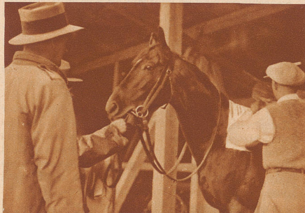
«Amalfi», gewohnt seine Aufgaben mit Leichtigkeit zu lösen, sieht gespannt, aber vollkommen ruhig, dem Kommenden entgegen und läßt sich gerne satteln