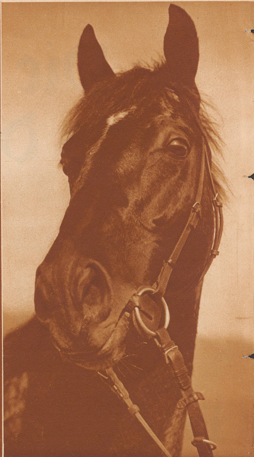
«Wisa-Amalfi» vor dem Rennen. Der Vollblüter wird in der frühen Morgenstunde des Renntages ins Grüne geführt und an der Hand bewegt. Viele Pferde spüren im voraus, wenn Renntag ist und verraten Unruhe. Es ist gerade dann im Rennstall größte Ruhe das erste Gebot

vom neuerrichteten jugoslawischen Generalkonsulat in Zürich