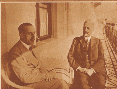
Der spanische Exkönig auf der Durchreise nach Basel, wo er seinen seit Jahren dort lebenden Onkel, den habsburgischen Erzherzog Eugen (rechts) besuchte