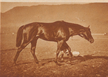
Nach dem Rennen wird «Amalfi» zur Beruhigung der Atmung langsam herumgeführt. Ein in voller Form befindliches Rennpferd wird bei normaler Temperatur kaum schwitzen, die große Anstrengung sieht man diesem Athleten nach kurzer Zeit kaum mehr an