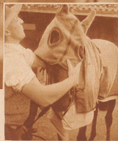
Links: Der Renntag brachte kühles, regnerisches Wetter. «Wisa-Amalfi» wird also am Abend, ehe es zum Grasen geht, warm eingepackt