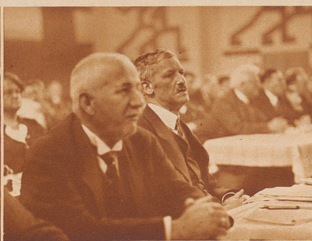
Der deutsche Reichstagsabgeordnete Rudolf Breitscheid (rechts) hört der Rede Vanderveldes zu