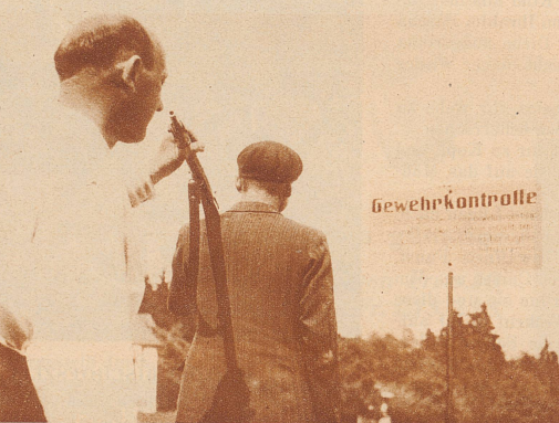
Gewehrkontrolle: Kein Schütze darf den Schießstand verlassen, bevor der Kontrollleur das Gewehr nachgesehen hat