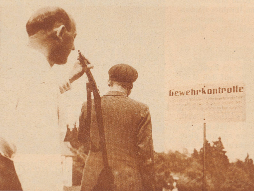
Gewehrkontrolle: Kein Schütze darf den Schießstand verlassen, bevor der Kontrollleur das Gewehr nachgesehen hat