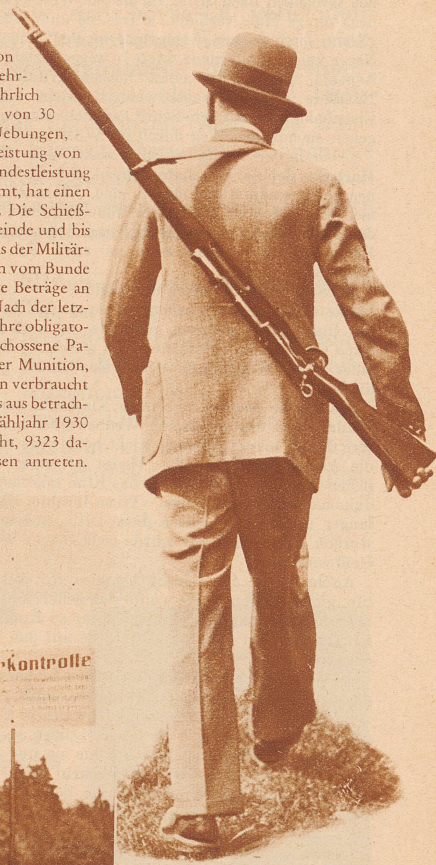
Das «Obligatorische» ist erfüllt, befriedigt zieht er nach Hause