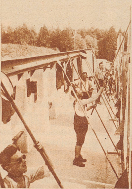
Die Zeiger an der Arbeit