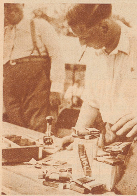
Der Munitionsverwalter in seinem Laden