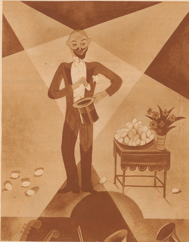
Der Zauberer auf der Bühne:

«... und hier das fünfzigste Ei, meine Herrschaften!»