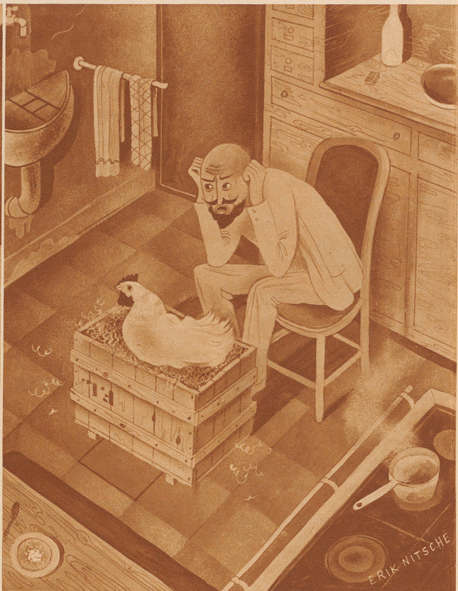
..... und zu Hause:

«... und hier das fünfzigste Ei, meine Herrschaften!»