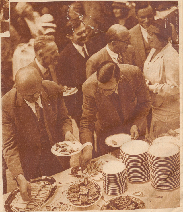
Fröhlicher Verkehr am Gartenbuffet

Die «Zürcher Illustrierte» erscheint Freitags • Schweizer. Abonnementspreise: Vierteljährlich Fr. 3.40, halbjährlich Fr. 6.40, jährlich Fr. 12.—. Bei der Post 30 Cts. mehr. Postscheck-Konto für Abonnements: Zürich VIII 3790 • Auslands-Abonnementspreis: Beim Versand als Drucksache: Vierteljährlich Fr. 4.50 bzw. Fr. 5.25, halbjährlich Fr. 8.65 bzw. Fr. 10.20, jährlich Fr. 16.70 bzw. Fr. 19.30. In den Ländern des Weltpostvereins bei Bestellung an Postämter etwas billiger. Insertionspreise: Die einspaltige Millimeterzeile Fr. —.60, fürs Ausland Fr. —.75; bei Platzvorschrift Fr. —.75, fürs Ausland Fr. 1.—. Schluß der Inseraten-Annahme: 14 Tage vor Erscheinen. Postscheck-Konto für Inserate: Zürich VIII 15769 Redaktion: Arnold Kübler, Chef-Redaktor. Der Nachdruck von Bildern und Texten ist nur mit ausdrücklicher Genehmigung der Redaktion gestattet. Druck, Verlags-Expedition und Inseraten-Annahme: Conzett & Huber, Graphische Etablissements, Zürich, Morgartenstraße 29 • Telegramme: ConzettHuber. • Telefon: 51.790