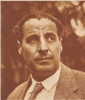
Dr. Ernst Toch (Berlin)

Zum erstmalig seit 1910 fand dieses große Fest wieder einmal in der Schweiz statt. Eine große Zahl ausländischer und schweizerischer Musiker kam anlässlich der Festtage in Zürich zusammen. Vergangenen Montag waren die Tonkünstler Gäste der Familie Dr. Schwarzenbach-Wille auf Bocken bei Horgen. Unsere Bilder zeigen ein paar ungezwungene Szenen dieses frohen Zusammenseins, sowie einige bei dieser Gelegenheit von unserem Photographen geknipste Komponisten, die im Rahmen des Zürcher-Festes «aufgeführt» wurden.