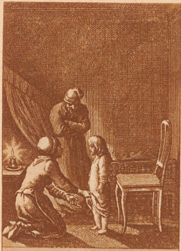
Hexen-Prozess in Glarus