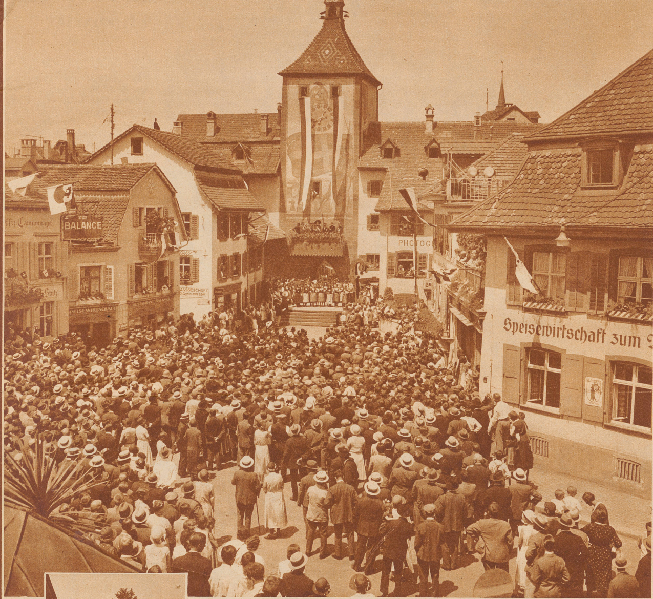
Vor dem obren Tor, dem Wahrzeichen Liestals, fand die Aufführung des von Dr. Karl Weber verfaßten Erinnerungsspiels statt. Eine riesige Menschenmenge wohnte der Vorführung bei, die mit einigen Bildern aus der Vergangenheit der Bodenständigkeit und Heimatfreude des basellandschaftlichen Volkes Ausdruck gab

An der gleichen Stelle, wo vor 100 Jahren ein Freiheitsbaum stand, vor dem Rathaus von Liestal, wurde nun wieder ein mächtiger Freiheitsbaum mit bunten Wimpeln in den kantonalen Farben aufgestellt. Die 26 m hohe Tanne ragte weit über die altertümlichen Häuser des Stadtderns empor