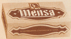
Carton à 10 Stück Fr. 2.—