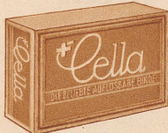
Carton à 10 Stück Fr. 1.80