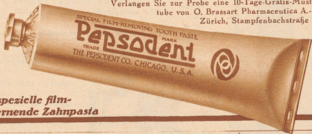
Die spezielle film-entfernende Zahnpasta

Verlangen Sie zur Probe eine 10-Tage-Gratis-Muster-tube von O. Brassart Pharmaceutica A. G., Zürich, Stampfenbachstraße 75.