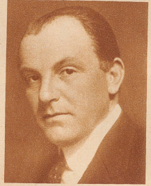
H. B. Butler (England) ist an Stelle des verstorbenen Albert Thomas zum Direktor des Internationalen Arbeitsamtes gewählt worden