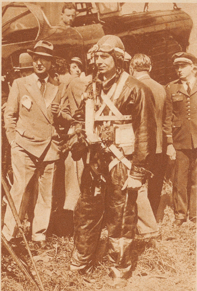
Rekord-Fallschirmsprung. Der französische Fallschirmspringer René Machenaud führte auf dem Flugfelde von Etampes einen Rekordsprung aus 7780 Meter Höhe aus. Diese Höhe zu erreichen, benötigte das Flugzeug 52 Minuten. Der Sprung zur Erde dauerte 23 Minuten. Den bisherigen Rekord hielt mit 7000 Meter der Belgier Coppens