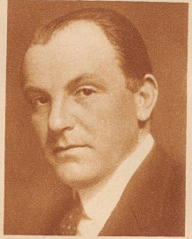
H. B. Butler (England) ist an Stelle des verstorbenen Albert Thomas zum Direktor des Internationalen Arbeitsamtes gewählt worden