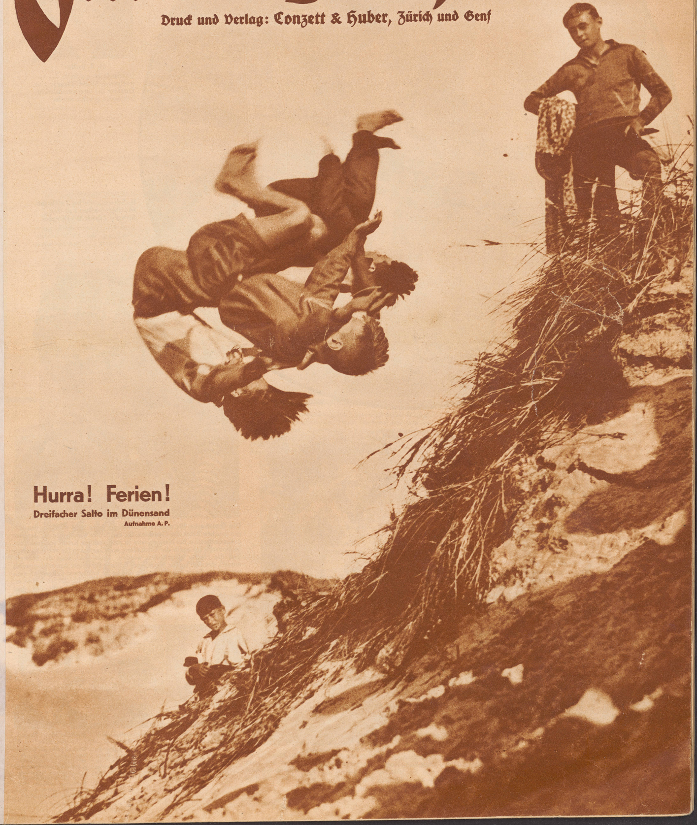
Hurra! Ferien! Dreifacher Salto im Dünenand

Druck und Verlag: Conzett & Huber, Zürich und Genf