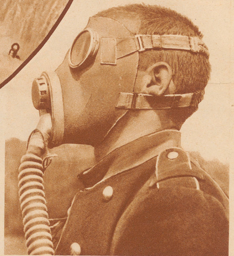
Die Gasmaske für unsere Armee. Im Jahre 1924 wurde in den eidgenössischen Räten der Gasschutz für die Armee beschlossen. In der vergangenen Session des Nationalrates ist jetzt auch ein Kredit von mehreren Millionen Franken für die Anschaffung von Gasmasken für vorläufig einen Teil des Heeres gutgeheissen worden. Unser Bild zeigt das Maskenmodell, das nach langer, sorgfältiger Prüfung für unsere Armee ausgewählt worden ist. Es ist eine Maske, die alle heute bekannten Giftgase zu neutralisieren vermag. Das Stück kostet 40 Franken. Die 400 000 Stück Masken, die etappenweise angeschafft werden sollen, belasten das Militärbudget mit 16 Millionen Franken. Die Handhabung der Maske wird in der gegenwärtigen Infanterie-Rekrutenschule in Zürich erstmals eingeübt