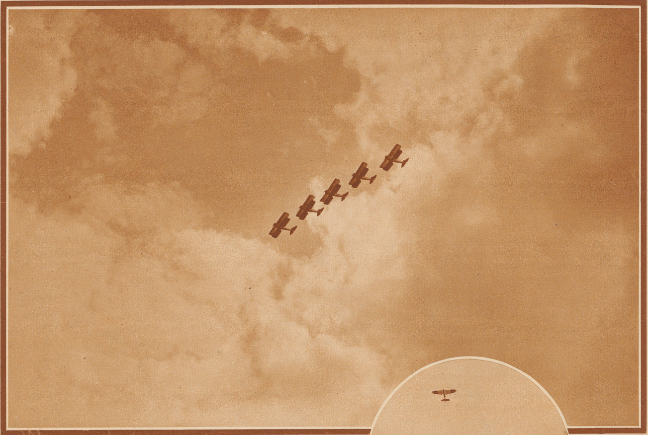
Italienische Militärflieger in einer Fünferstaffel zeigen in einer Höhe von 1000 m über dem Dübendorfer Flugfeld ihre berühmten akrobatischen Kunststücke