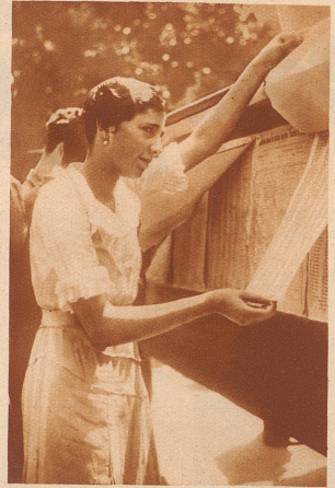
Zum erstmalig in Spaniens Geschichte wählen die Frauen: Ein junges Mädchen prüft die Wahllisten an den öffentlichen Anschlagstellen. Mit dem Wahlrecht der Frau ist ein ganz neuer Faktor in das politische Leben des Landes gekommen