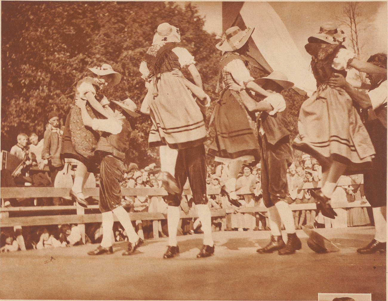
Der Maitlilupf. Bei schönstem Wetter fand letzten Sonntag in Klosters das Prätigauer Trachtenfest statt. Viel Vergnügen bereitete den zahlreichen Zuschauern der Ernte-Reigen, ein gut einheimischer, rassischer Tanz aus Großvaters Zeit, der handfeste Burschen und lüpfige Maitli voraussetzt