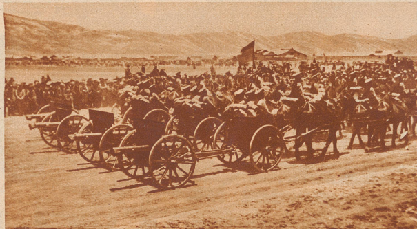
Der Konflikt zwischen Bolivien und Paraguay. Bei dem Konflikt zwischen den beiden südamerikanischen Staaten, der in einen Krieg überzugehen droht, geht es um ein ungeheures, fast wildes und ödes Gebiet von 400 000 km 2 an der Grenze beider Länder. Das Land ist gänzlich unkultiviert und unerschlossen; verständlich wird aber die Hitze des Streites, wenn man hört, daß im Gran Chaco mehrfach Ölquellen gefunden wurden. — Bild: Bolivianische Artillerie im Aufmarsch. Die Truppen Boliviens sind durchwegs mit deutschen Vorkriegsuniformen versehen