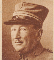
Oberstleutnant Roger de la Harpe starb 60-jährig in Vevey. Während des Krieges leitete er die Internierung englischer Kriegsgefangener in der Schweiz. Seit 1929 gehörte er dem Direktionskomitee des Schweizerischen Roten Kreuzes an