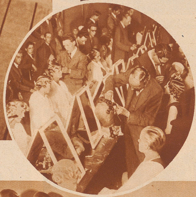
Trägerinnen der neuen Modfrisuren am großen Schaufisieren um den goldenen Pokal im 'St. James' Club in London