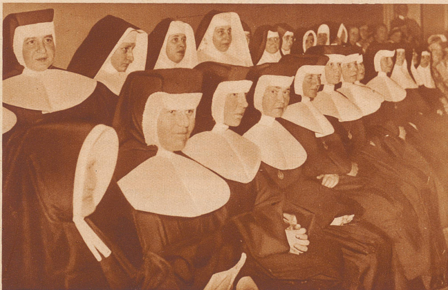
An einer politischen Frauenkundgebung vor den Reichstagswahlen: Nonnen unter den Zuhörerinnen