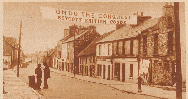
«Boycottiert britische Waren!» An der Wirtschaftskonferenz in Ottawa wird gegenwärtig über die verschiedenen Sorgen Groß-Britanniens und seiner Dominions beraten. Eine der größten dieser Sorgen ist augenblicklich die irische Frage, die sich immer mehr kompliziert und in einen unheilvollen Kreislauf gerät: Es begann mit der Weigerung Irlands, Annuitäten zu zahlen, worauf England hohe Einfuhrzölle für irische Waren schuf und den irischen Export ruinierte. Als Antwort fordert Irland überall im ganzen Lande zum Boykott britischer Waren auf. — Unser Bild zeigt ein Transparent in einem kleinen irischen Städtchen: «Macht die Eroberung ungeschehen!» (Gemeint ist die Eroberung Irlands durch England vor vielen hundert Jahren.) «Boycottiert britische Waren!»