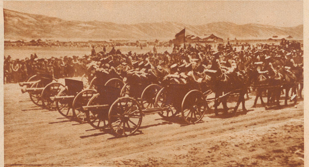
Der Konflikt zwischen Bolivien und Paraguay. Bei dem Konflikt zwischen den beiden südamerikanischen Staaten, der in einen Krieg überzugehen droht, geht es um ein ungeheures, fast wildes und ödes Gebiet von 400 000 km 2 an der Grenze beider Länder. Das Land ist gänzlich unkultiviert und unerschlossen; verständlich wird aber die Hitze des Streites, wenn man hört, daß im Gran Chaco mehrfach Ölquellen gefunden wurden. — Bild: Bolivianische Artillerie im Aufmarsch. Die Truppen Boliviens sind durchwegs mit deutschen Vorkriegsuniformen versehen