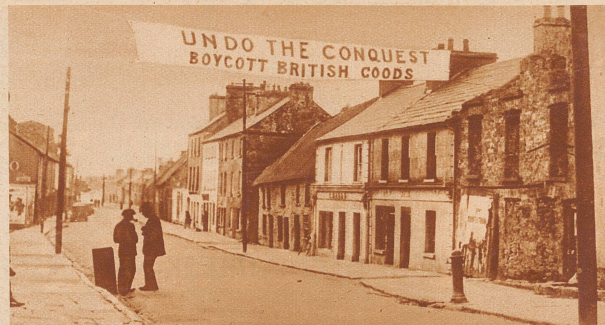
«Boycottiert britische Waren!» An der Wirtschaftskonferenz in Ottawa wird gegenwärtig über die verschiedenen Sorgen Groß-Britanniens und seiner Dominions beraten. Eine der größten dieser Sorgen ist augenblicklich die irische Frage, die sich immer mehr kompliziert und in einen unheilvollen Kreislauf gerät: Es begann mit der Weigerung Irlands, Annuitäten zu zahlen, worauf England hohe Einfuhrzölle für irische Waren schuf und den irischen Export ruinierte. Als Antwort fordert Irland überall im ganzen Lande zum Boykott britischer Waren auf. — Unser Bild zeigt ein Transparent in einem kleinen irischen Städtchen: «Macht die Eroberung ungeschehen!» (Gemeint ist die Eroberung Irlands durch England vor vielen hundert Jahren.) «Boycottiert britische Waren!»